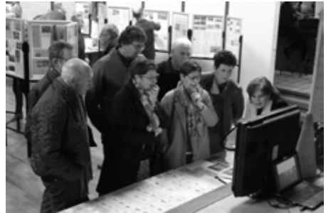
Expositie historische werkgroep, 26 november 2017.

Op donderdag 8 februari kun je meedoen aan de cursus 'Levensreddend Handelen' (AED) van Jan Hoefnagel. Jan excelleerde afgelopen jaar naast Dionne Stax in het goed bekeken programma 'Eerste hulp bij